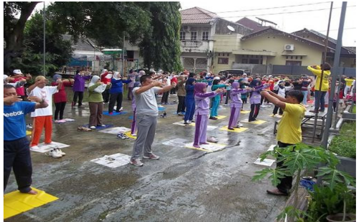
图: 印尼民众学炼法轮功

早晨六点半,当地不少居民来到广场,他们先是听了对法轮大法的简单介绍,接着在前面两个学员的示范动作下,开始练习五套功法。在炼到第四套功法的时候,天上开始下起了毛毛雨,等炼到第五套功法的时候,刚刚开始五分钟雨就大起来了。这时,有些人请学员到旁边的屋子里交流,有的人希望能够继续炼完第五套功法,学员们也决定继续练习,雨