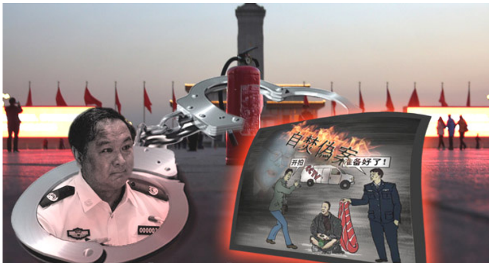
李东生亲自监制了中央电视台“天安门自焚伪案”的谎言在全球传播的整个秘密过程。

2001年1月23日，天安门广场发生自焚事件，中央电视台一反新闻审查的常态，于第一时间并以以前所未有的高调在“焦点访谈”报导，把事