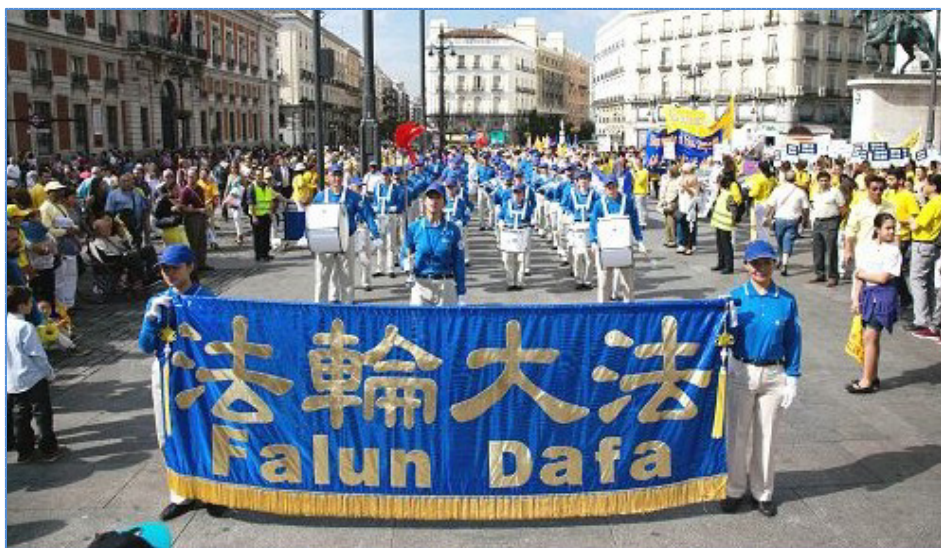
图：法轮功学员在马德里举行盛大游行，传播真相

过去他练过其它功法，但没能在精神层面更深入一步。有次他对自己说，“我需要一种能让我在精神层面