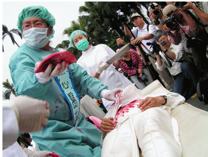
■ 法轮功学员在演示中共活摘器官

报导说，人权观察主任布雷德·亚当斯表示，在中国，一直有贩卖人体器官的事情发生。我们所知道的是，中共从一开始否认，到现在承认。有一个日本摄影组，拍摄到东北一个城镇的一所医院新加盖的楼，完全是用来做器官移植用的。这些器