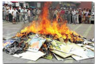
Em 1999 era comum se ver livros e materiais sendo queimados. As casas dos praticantes eram saqueadas, eles eram insultados e quase sempre presos.