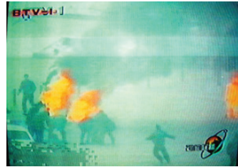
Esta cena foi vista por milhões de chineses inúmeras vezes na TV, uma falsa autoimolação para jogar o público contra o Falun Gong.

A mídia estatal começou a afirmar que Falun Gong “levou a mais de 1.400 mortes.” A mídia mostrou ao público imagens horríveis e histórias emocionais. Claro, o Partido nunca forneceu evidências para apoiar estas afirmações e impediu tentativas de investigações independentes. No final, descobriu-se que as histórias eram fabricadas. Alguns dos que supostamente morreram, nunca existiram; outros morreram de causas naturais, sem nenhuma relação com o fato de praticarem Falun Gong.