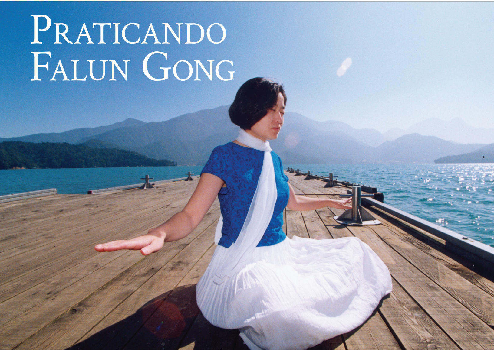
Alcançar um estado de profunda tranquilidade é o objetivo da meditação sentada, o quinto exercício do Falun Gong, “Fortalecendo Poderes Divinos”.