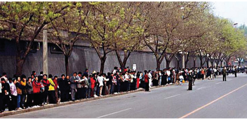
“Cercos à Sede Central do Governo” ou manifestação pacífica? Autoridades comunistas consideram isso como “um cerco”, transformando os fatos em ficção, para de alguma forma “justificar” a perseguição ao Falun Gong nas mentes do público.