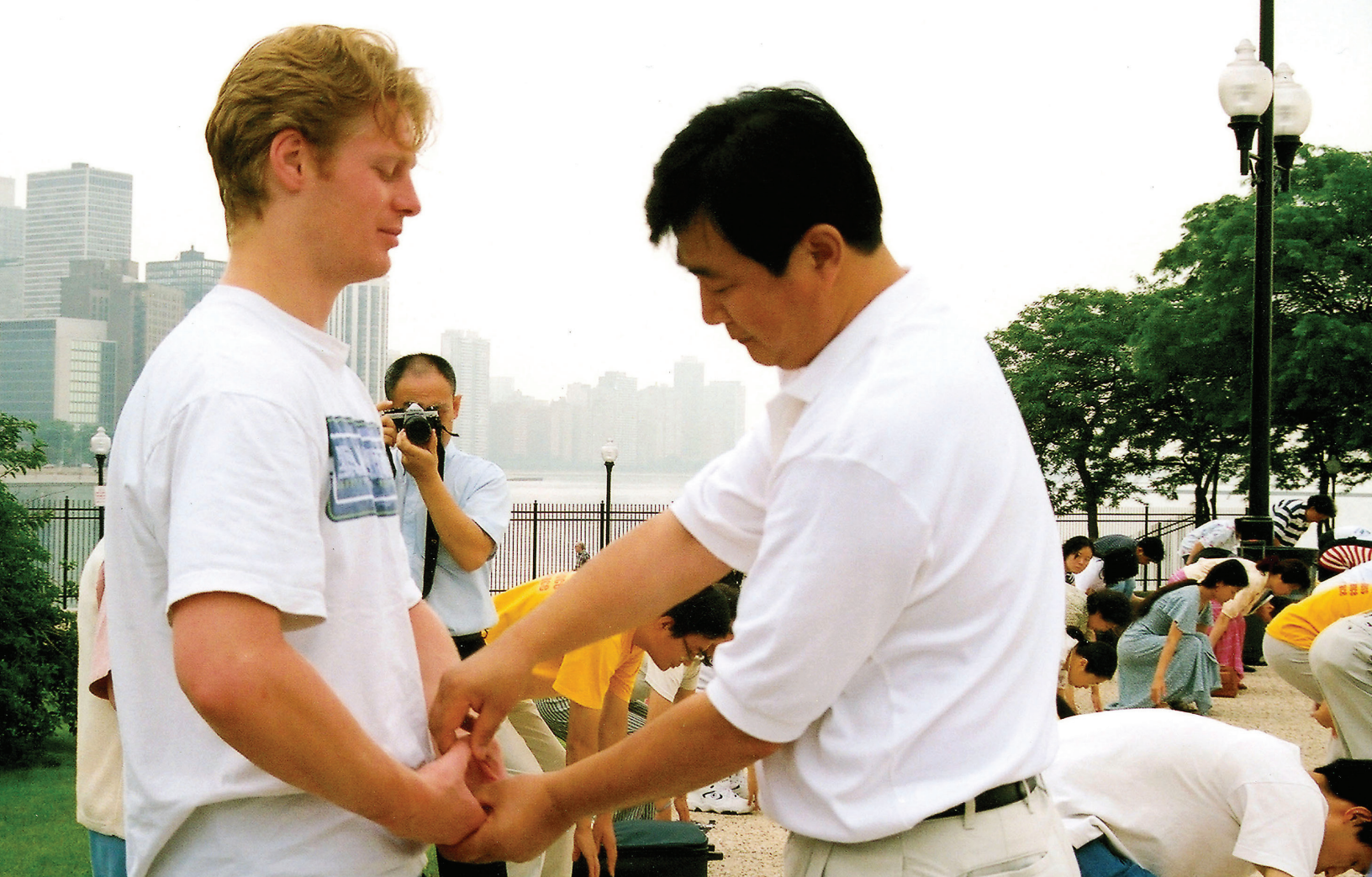
O fundador do Falun Dafa, sr. Li Hongzhi, corrigindo movimentos dos exercícios de um estudante em Chicago.