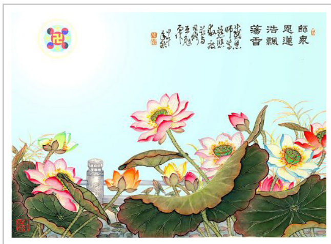
法轮功学员绘画作品: 颂师恩赞香莲

深刻感受到有很多人已了解真相,她常坐在电脑前帮网友声明三退(退出中共党、团、队,简称三退),“有时整天都没离开座位,就是不断地帮人办理三退。”有时她一天能退三、四十人,很多人跟她道谢。她觉得大陆民众透过网路,得到了很多讯息,所以自己还没有讲很多真相,就有好多人要声明三退。一次她告诉网友天安门自焚案是共产党造假的,是为了诬蔑法轮功的假案。网友告诉她:“我当时就在现场,我早就知道那是假的。”