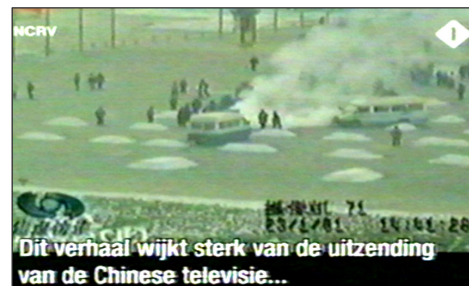
图:荷兰国家电视一台 2005 年 3 月 14 日《时事评论》节目揭露“天安门自焚”伪案,质疑突发事件中两辆警车为何备有(据中共报导)20 多个灭火器。国际教育发展组织 2001 年 8 月 14 日在联合国会议上声明:整个自焚事件是政府导演的。中国代表团面对确凿证据,没有辩辞。

第二天一大早,女孩把我拉到没人的地方,硬要给我 100 元钱,让我转交给做资料的人。她说:你们大法弟子太伟大了,身处魔难,却省吃俭用地攒钱做资料救人,不图回报,我居然把台历撕了,太对不起你们法轮