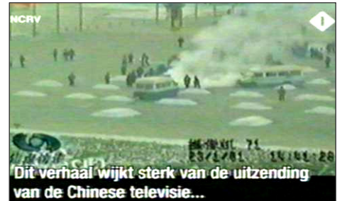
图:荷兰国家电视一台2005年3月14日《时事评论》节目揭露“天安门自焚”伪案,质疑突发事件中两辆警车为何备有(据中共报导)20多个灭火器。国际教育发展组织2001年8月14日在联合国会议上声明:整个自焚事件是政府导演的。中国代表团面对确凿证据,没有辩辞。

第二天一大早,女孩把我拉到没人的地方,硬要给我100元钱,让我转交给做资料的人。她说:你们大法弟子太伟大了,身处魔难,却省吃俭用地攒钱做资料救人,不图回报,我居然把台历撕了,太对不起你们法轮