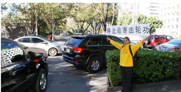
墨西哥法轮功学员在张德江入住的酒店外抗议

◎2014 年 11 月 25 日至 27 日,中共人大常委会委员长张德江访问墨西哥首都墨西哥城,他因在中国积极参与迫害法轮功,受到了