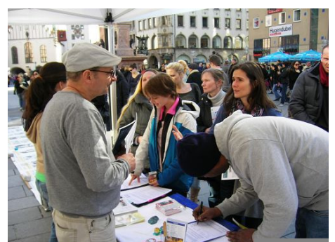
图：法轮功学员在慕尼黑市中心的玛利亚广场设立真相点，揭露中共酷刑迫害法轮功学员，并活摘器官的恶行。许多路人驻足观看真相图片，并询问真相。了解真相的人们纷纷签名支持制止迫害。◇