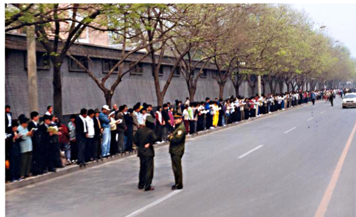
1999年4月25日和平上访现场

出于对政府的信任，同时为了维护公民的合法权利，1999年4月25日上万名法轮功学员自发来到国务院信访办（当时位于中南海附近）和平上访。他们静静地站在路旁，没有口号和标语，没有影响交通。