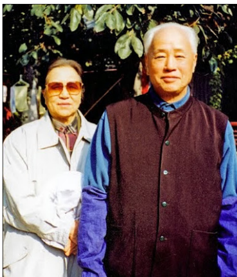
图：晚年赵紫阳、梁伯琪夫妇

他们返回北京后，我也曾去北京富强胡同看望他们。我也向他们身边的工作人员讲述法轮大法的美好。在北京时，我曾经和梁阿姨一起去参加集