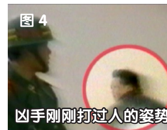
凶手刚刚打过人的姿势