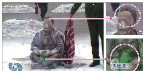
▲ 塑料雪碧瓶竟然完好无损，最易着火的头发也还完整。