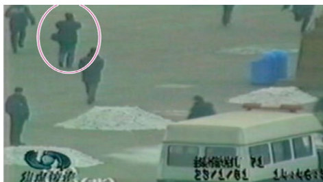
▲ 圈中的男子，在军警间从容拍摄。

“天安门自焚”本应是突发事件，在短短一两分钟的时间里，巡逻的警察竟拿出十几个灭火器，还有灭火毯，人们不禁要问：难道天安门巡逻的警察每天都背着灭火器、带着灭火毯？显然是有备而来！