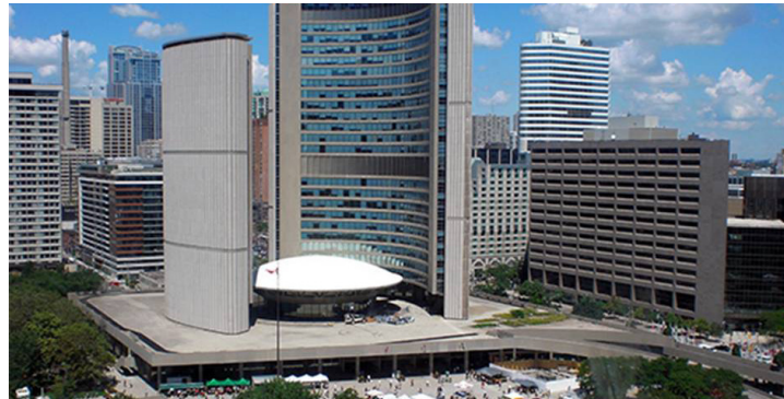
图：多伦多市政大厦

潘女士告诉学生：“马克思在他的《共产党宣言》中明确写道：一个共产主义的幽灵，在欧洲的上空飘荡着。共产党其实是个幽灵。当庞大的共产主义阵营解体后，这个幽灵就龟缩在了中华大地上，它在世上的表现就是中共的邪党组织。