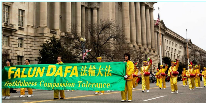
图：2014年3月16日下午，美国华盛顿DC举行圣·派翠克节大游行。法轮功学员组成的腰鼓队是一百多个游行队伍中的唯一华人团体，受到两旁各族裔民众的欢迎。

在恶报病痛的折磨中，在法轮大法弟子不辞辛苦地慈悲讲真相中，夫妻俩终于明白了，认识到：法轮大法好！法轮大法是正法！对法轮大法弟子迫害不得！