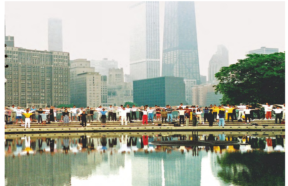
△ 파룬궁 수련생들 미국 시카고에서의 단체 련공