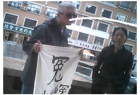
被迫害者家属在申诉冤情、反迫害

在开庭期间，律师多次指出法庭审判程序违背了“刑事诉讼法”，并分别要求审判长、公诉人回避，但均