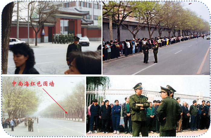
▲ 1999 年的 4 月 25 日，法轮功学员和平上访。离开后地上无一片纸屑，连警察扔的烟头都被他们捡起来了。有警察感慨地说：“看，这就是德！”

张延超具体蒙难的日子至今未明。他是在 2002 年 3 月 28 日被绑架的，于是，每年的 3 月 28 日，成了西黄旗村乡亲们祭奠张延超的日子。乡亲们至今也