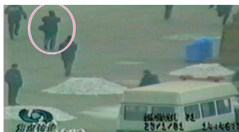
▲一男子在从容拍摄。

自焚事件后，一位电视台的朋友说：“自焚一定是政府演的戏。记者上天安门都要事先申请采访内容，审批是很严的，我们扛摄像机10