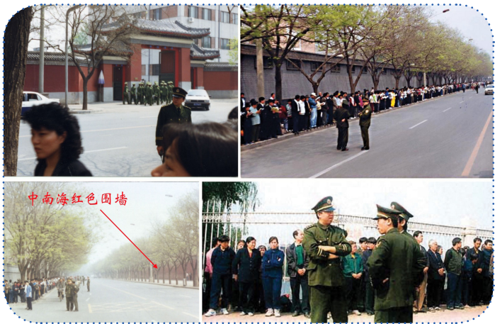
▲ 1999 年的 4 月 25 日，法轮功学员和平上访。离开后地上无一片纸屑，连警察扔的烟头都被他们捡起来了。有警察感慨地说：“看，这就是德！”

随后不久，国务院信访办公室在官方报纸上表态：政府没有对气功包括法轮功的限制政策。这是国务院信访办对“4. 25”法轮功群众上访的公开答复。