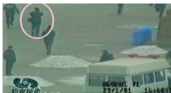
▲一男子在从容拍摄。

自焚事件后，一位电视台的朋友说：“自焚一定是政府演的戏。记者上天安门都要事先申请采访内容，审批是很严的，我们扛摄像机10