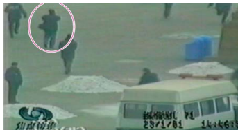
▲一男子在从容拍摄。

自焚事件后，一位电视台的朋友说：“自焚一定是政府演的戏。记者上天安门都要事先申请采访内容，审批是很严的，我们扛摄像机