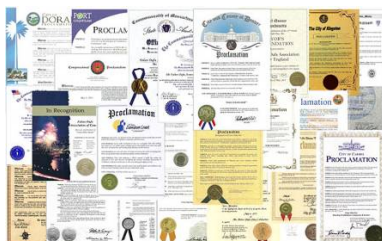
■ 法轮功获得的部分褒奖

法轮功至今已弘传 100 多个国家和地区，法轮功的书籍被译成 30 多种语言出版发行，并可在互联网上免费下载。李洪志先生和法轮大法获得各国政府各类褒奖、支持决议案和信函超过 3000 项。