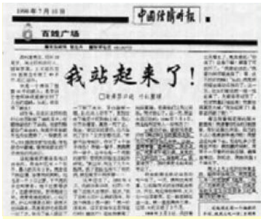
■1998 年 7 月 10 日《中国经济时报》刊文讲述一个瘫痪 16 年的病人修炼法轮功三个月痊愈的故事。

1998 年下半年，前人大老干部对法轮功进行了数月的调查，得出“法轮功于国于民有百利而无一害”的结论，并向中央政治局提交了调查报告。