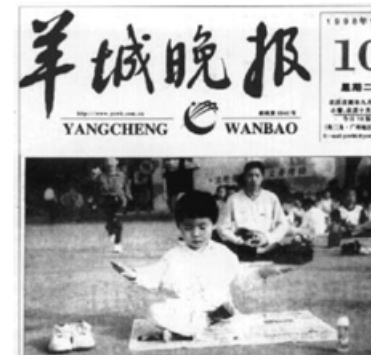
■ 1998年11月10日《羊城晚报》头版新闻报道：《老少皆练法轮功》。