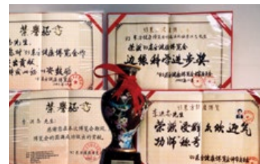
■ 李洪志老师荣获1993年北京东方健康博览会“边缘科学进步奖”和“受群众欢迎气功师”称号。

弘传世界 法轮功已弘传世界100多个国家和地区，受到世界人民的喜爱和尊敬，因其对人类身心健康做出的杰出贡献，法轮大法获得各国各界褒奖、支持议案、支持信函3600多项。法轮功主要著作《转法轮》已经有40种文字版本，并可在互联网上免费下载、阅读。