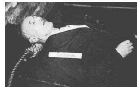
■ 被处以绞刑的施特莱彻。

国际社会对仇恨宣传高度重视，认为，仇恨宣传比其它任何罪行都重大和影响深远，是人类面临的最主要危险之一。国际法庭曾在判定反犹太杂志《先锋报》主编施特莱彻的罪行（在报纸上发表对犹太人的诽谤宣传）时，对仇恨宣传的毒害做了深刻的描述：“其他任何被告造成的苦难都可随其被捕而停止，而施特莱彻的罪行的影响，是他那打入成千上万人的头脑中的毒害——他留下的遗产是一个因他