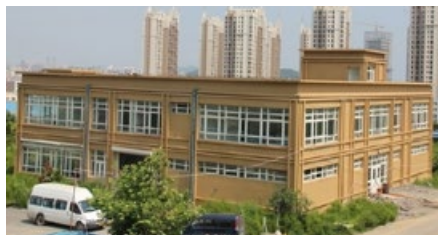
■ 哈根斯大连生物塑化公司：尸体加工厂，经营者为德国人冯·哈根斯。“王立军事件”后，此尸体加工厂突然人去楼空。

薄熙来到重庆任职期间，重庆市就有18位法轮功学员被迫害致死，41人被判刑，被非法劳教的法轮功学员多达211人，537人次被绑架、抄家和骚扰。重庆市和各区县设立的迫害法轮功学员的洗脑班（黑监狱）有16个，每个洗脑班都投资超过百万元。为了强迫法轮功学员放弃对“真、善、忍”的信仰，他们实施了暴力灌食、药物迫害、站立体罚、军蹲、暴晒、不让睡觉、不准上厕所、拳打脚踢、刑讯逼供等等恶行。