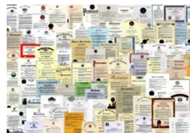
■ 法轮功获得的部分褒奖。