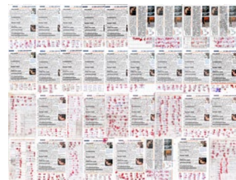
■ 2014年4月，1006名张家口民众签名谴责中共活摘器官。

2013年12月至2014年6月，河北张家口、唐山等地和湖南共有26622人联名反对中共活摘法轮功学员器官，其中河北22272人。