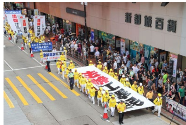
■ 2018年7月22日，千名法轮功学员在香港举行反迫害19周年集会游行。

个国家及地区超过303万人联署举报江泽民的罪行，被外界称为21世纪“全球最大的人权义