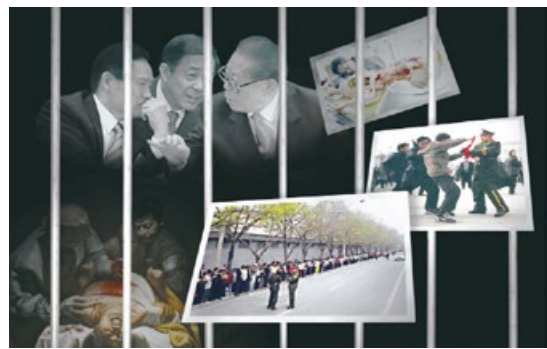
■ 20年来，以江泽民为首迫害法轮功的“血债帮”成员，罪行累累。（合成图片）

1999年7月20日，中共前党魁江泽民企图通过发起一场大的迫害运动在党内树立权威，来排挤对手，于是悍然发动了对法轮功的残酷迫害。在江泽民的对法轮功“名誉上搞臭、经济上截断、肉体上消灭”的灭绝政策下，中共犯下了滔天罪恶。