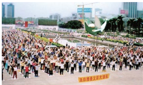
■ 1998年，广州的一个法轮功炼功点的学员们在晨炼。

1999年10月30日，全国人大为了迎合当时的政治形势，匆忙补充了这一决定《关于取缔邪教组织、防范和惩治邪教活动的决定》，此《决定》与中国宪法第36条“中华人民共和国公民有宗教信仰自由”相违背而无效，不能适用。此外，该《决定》从头到尾都没有出现过“法轮功”三个字，“法无明文不为罪”是基本的法制原则。