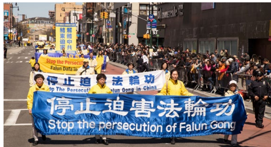
■ 2018年美国纽约法拉盛游行。