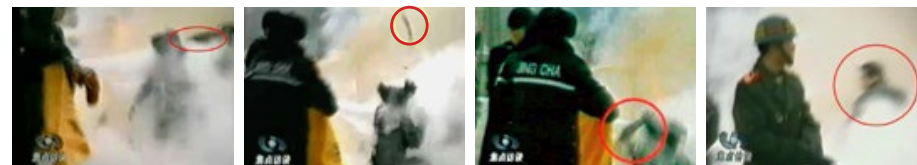
凶手猛击刘的头部