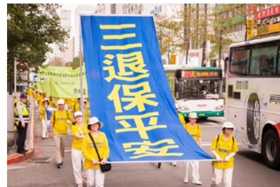
■ 5千名法轮功学员台湾台北大游行，声援三亿退党潮。

有人可能说“自己心中退党就算退了，不必声明”；还有人认为“自己多年没交党费了，就算自动退党了”；或者认为“年龄大了，已经自动退团、退队了”。但这都不能抹掉加入党、团、队时举着右手宣誓而被打上的印记，无法“解除毒誓”。只有采取公开的方式退出，有行为的表示，才能解除这个“毒誓”。神看人心，只要真心声明“三退”（退党团队），用真名、化名、小名皆可。