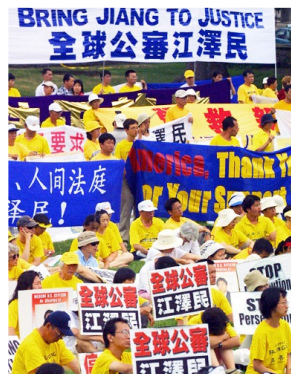
■ 民众在华盛顿举行“审江”集会。

江泽民作为发起对法轮功残酷迫害的元凶先后在全球30个城市和地区，被以“反人类罪”“群体灭绝罪”和“酷刑罪”等罪名，在50多个刑事和民事诉讼案中被起诉。从2001年至今，在全球40多个国家及国际机构，因迫害法轮功被起诉的中共高官达50多名，包括江泽民、罗干、周永康、曾庆红、刘京、薄熙来、苏荣等；被海外法庭宣判有罪的还有刘淇、夏德仁、赵志飞、潘新春、郭传杰等。