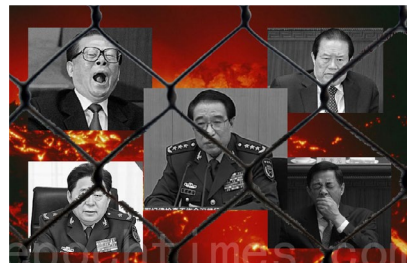
■ 徐才厚的高层官场关系图

2014年3月15日，数十名武警从北京301医院将病床上的徐才厚带走。同时带走的还有他的妻子、女儿和秘书。2014年6月30日，前中共军委副主席徐才厚被移送军事检察院处理。