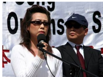
■ 苏家屯集中营惨案两名证人皮特和安妮。

2006年3月 证人安妮（化名） 指证，中共活摘法轮功学员器官的秘密集中营就设在辽宁省血栓中西医结合医院的“地下医疗设施”里。她的前夫就是苏家屯集中营活体器官摘取主刀医生之一。他是