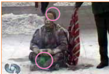
头发和塑料瓶子烧不坏？