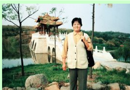
图：潍坊被迫害致死的法轮功学员

文章描述道：“警察用沉重的塑胶警棍毒打她的小腿、脚、后腰。他们用赶牛用的刺棒猛击她的头部和