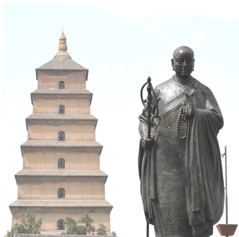
■ 西安大雁塔前的玄奘塑像

【明慧网】《西游记》中唐僧的原型是唐代的玄奘法师，他只身一人去古印度求法取经，历尽艰辛，行程数万里。玄奘 19 年后载誉归来时，老百姓倾城出动自发迎接，场面空前盛大。