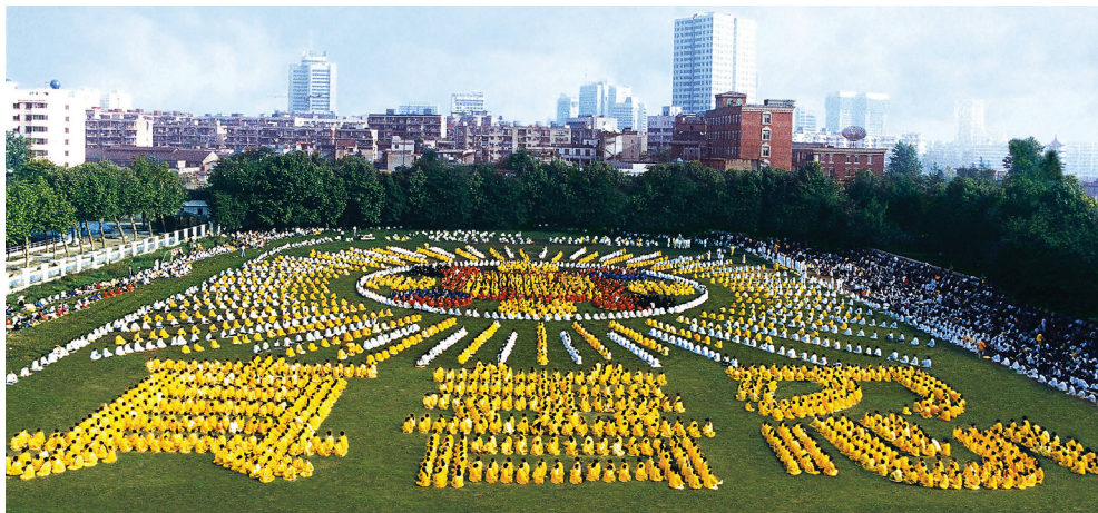
■ 1998 年武汉法轮功学员集体排字炼功

1992 年到 1994 年,李洪志先生应各地官方气功科学研究会邀请,在全国 23 个城市举办了 54 期法轮功学习班,参加的学员六万多人。期间发生了很多祛病健身的神迹,使得很多气功爱好者走入修炼,到 1999 年 7 月中国已经有上亿人修炼法轮功。