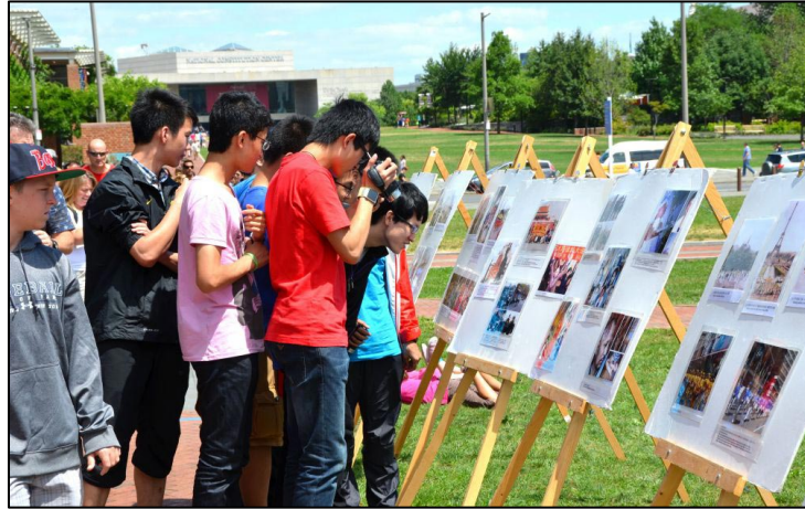
■ 费城自由钟独立宫广场，中国大陆的游客争相阅读介绍法轮功和反迫害的真相展板，索要真相资料，并拍照录像。

谈女士解答了这位游客的疑惑：其实一开始，大陆官方与媒体都是支持法轮功的，因为既祛病健身，而且真善忍又促进了人与人之间的关系。“但随着炼功人数的快速增长，当时掌权的江泽民就开始有想法了。事实上，当时七个政治局常委中只有江泽民主张镇压，而且称之为‘你死我活’的斗争。”看一看中共的历史就会明白，从“三反”、“五反”，