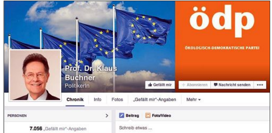
欧洲议会人权委员会议员克劳斯·布赫讷（Klaus Buchner）的脸书截图

第二天，他们遭到建三江市警察绑架，四律师被戴黑头套及酷刑折磨，共被打断24根肋骨，唐吉田律师一人被打断10根肋骨。他向媒体透露，在被暴打过程中，他被恶警威胁说，要