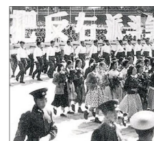
◆ 反右 (1957-1958)