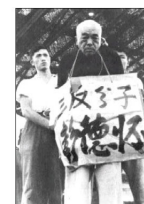
◆ 文革 (1966-1976)