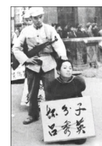
◆ 三反五反 (1951-1952)