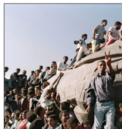
图1：1989年5月，匈牙利执政党宣布实行多党制，并开始拆除通往奥地利边界的铁丝网，打开了东德居民经匈入奥、逃往西德的出口。图为同年8月19日，匈牙利开放通往奥地利的边境，大批东德居民由此逃往西德。