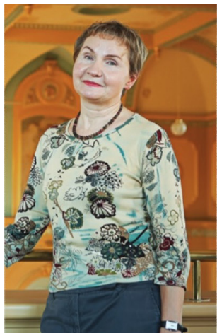
画家芭芭拉·沙费尔