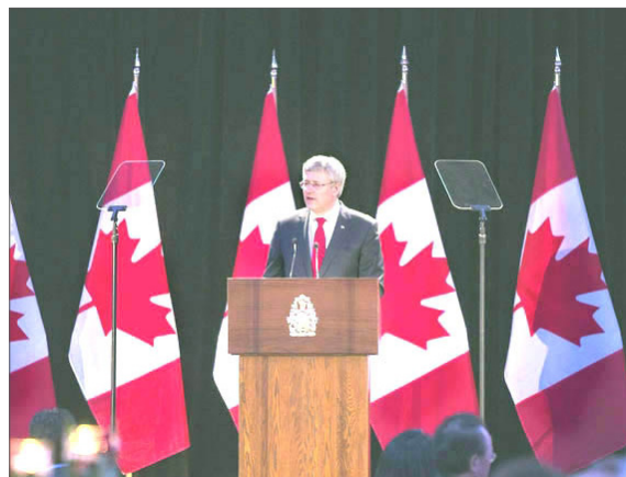
加拿大总理哈珀：共产主义是致命思想瘟疫。

在有着“二十世纪逃离共产暴政者的避难所”之称的加拿大，2014年5月，总理斯蒂芬·哈珀在渥太华建造共产主义受害者纪念碑筹备晚会中表示“历史清楚地告诉我们，承诺乌托邦的政治意识形态都走向反面，导致的是人间地狱”，“共产主义是最致命的思想瘟疫”。