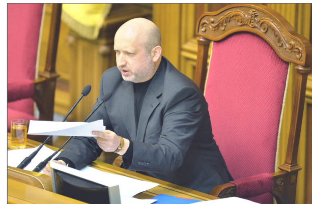
乌克兰议会议长图尔奇诺夫 (Aleksandr Turchynov) 于 2014 年 7 月 25 日在议会上宣布解散共产党党团

国会议员邦达尔丘克认为，光取缔共产党还不够，共产主义意识形态反人性，对国家和民族造成了空前的破坏，应被禁止。国会议员 Igor Miroshnichenko 则说：“这是一个憎恨人类的意识形态，直接导致了三次大饥荒，屠杀了数百万乌克兰人并破坏国家，破坏乌克兰的语言、文化和民族。”此后，又有一大批乌克兰共产党议员宣布退党。