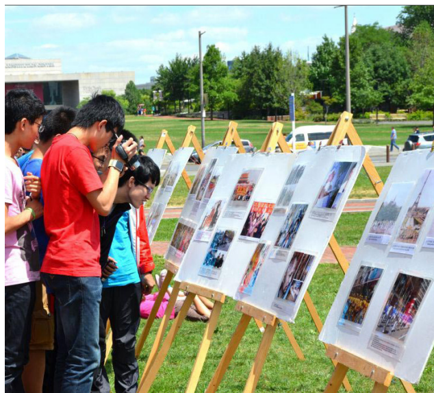
美国费城自由钟独立宫广场，来自中国大陆的游客阅读、拍摄介绍法轮功和反迫害内容的真相展板。