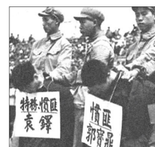
◆ 镇压“反革命” (1950-1952)