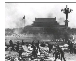
◆ 六四屠城 (1989)