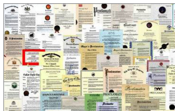
来自国际社会的褒奖（部分）

◎ 弘传世界 法轮大法已弘传100多个国家，受到世界人民的爱戴和尊敬。李洪志先生和法轮大法因对人类身心健康做出的杰出贡献，获各国政府褒奖、支持议案和信函3000多项。法轮功书籍被译成40种语言，在全球出版发行，并可在互联网上免费下载。◇