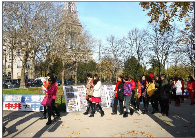
法国巴黎艾菲尔铁塔附近的法轮功真相点

了感人的一幕：烈日下，一位来自中国大陆的年轻游客，帮助法轮功学员高举真相展板，站了20分钟。这位小伙子的义举，感动了整团的游客，他们纷纷表示愿意“三退”。