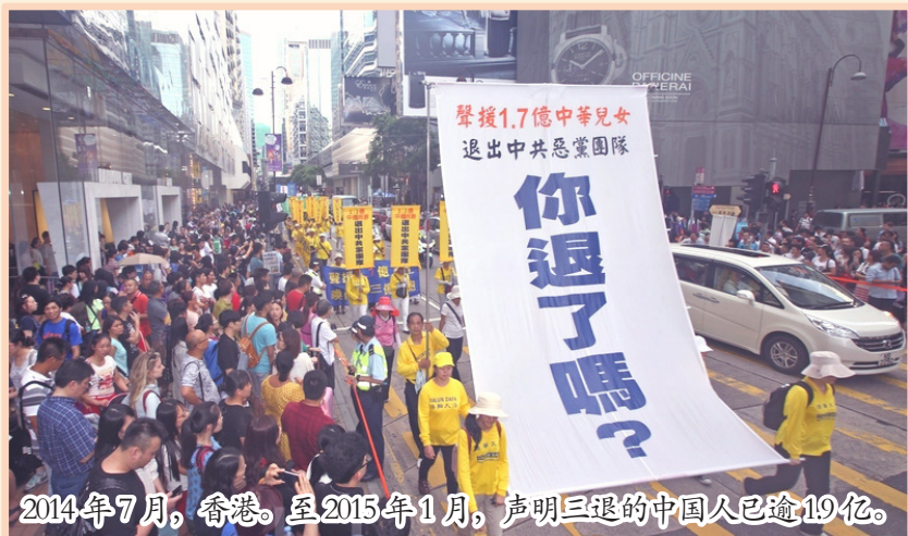
2014年7月，香港。至2015年1月，声明三退的中国人已逾1.9亿。