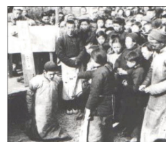
◆ 土改 (1950-1952)

正教的特点是讲善。而邪教恰恰相反，它推崇谎言、暴力，行事极端，漠视人性和生命。中共夺权 60 多年以来，从土改、镇反、三反、五反、反右、大跃进、文革、六四到迫害法轮功，历次运动中，8000 万中国人被害死，超过两次世界大战死亡人数的总和，是希特勒大屠杀的 13 倍，相当于 60 年来每 3 个月进行一次“南京大屠杀”。