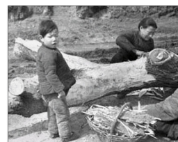
◆ 大跃进导致大饥荒 (1959-1961)