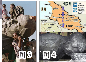
图 4：格鲁吉亚，共产暴君斯大林故乡，彻底抛弃共产主义。图为当地一座斯大林塑像被丢弃在废旧的轮胎旁。格鲁吉亚颁布法律，清除公共场所的镰刀、锤子、红星等共产党标志；禁止前共产党官员担任公职，包括部长、局长、法官、高校校长、系主任和公共广播电视机构负责人等职。