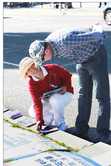
加拿大西部著名景点维多利亚市的省议会大厦附近，游客听法轮功学员讲真相。

的电话，多半是中国官员在海外景点拿到了真相资料，回到旅馆仔细看过之后明白了，按照资料上提供的退党热线号码打电话，要求“三退”，而且要求：“就用真名退。”