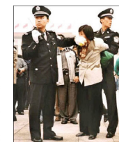
◆ 迫害法轮功 (1999 - 现在)