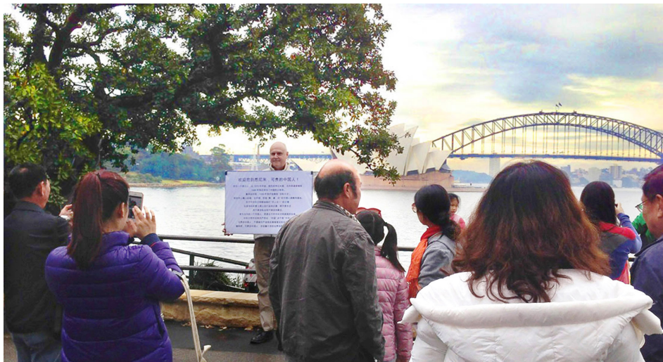
悉尼歌剧院景点，中国大陆游客争相对约翰·戴勒先生拍照。