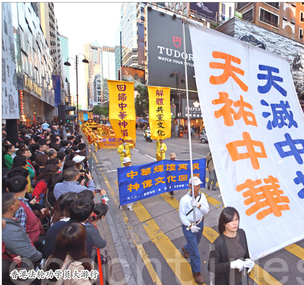
香港法轮功学员大游行