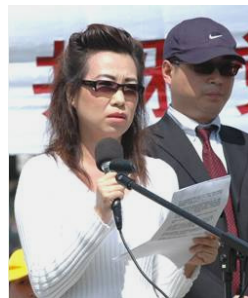
■2006年安妮在华盛顿举行的新闻发布会上指证中共活摘器官罪行。