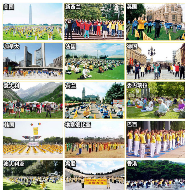
■ 世界各地法轮功学员集体炼功图片集锦

您是一个善良正直的人，所以很难看清中共的本质，因为一个好人是很难理解变态杀人狂的行为模式的。如今“你是党员”成了网络上最狠的骂人话——等于说这个人没有人性，人们都在唾弃它的罪行，因为善良的人都不愿意与邪恶为伍，您说呢？