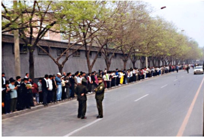
■ 秩序井然的4·25上访民众 “4·25”上访的起因是天津事件：1999年4月11日，罗干的连襟何祚庥在《青少年科技博览》上发表诬蔑法轮功的文章，法轮功学员自发前往该杂志编辑部澄清事实。当杂志社方面准备发声明更正之际，4月23日，天津市突然出动防暴警察，殴打和非法抓捕法轮功学员，致使学员流血受伤，40多人被抓。