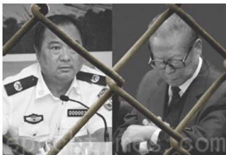
2015年8月21日，中共公安部副部长、江泽民集团迫害法轮功的主要打手李东生被提起公诉。（合成图）

为延续这场不得人心的迫害，在江氏指令下，由曾庆红、罗干、李东生共同策划，在2001年除夕导演了“天安门自焚”假案，李东