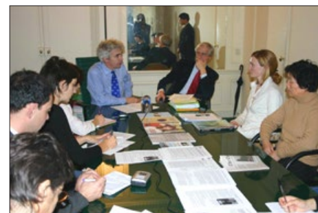
法国著名大律师威廉·布赫冬（后左）专长受理反人类罪案件，他日前表示：世界合作起诉江泽民完全可行，他本人十分愿意接手此类案件，并做好了与各国律师合作的准备。