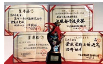
1993年北京东方健康博览会上的最高奖“边缘科学进步奖”和大会“特别金奖”

● 弘传世界：法轮大法已弘传到100多个国家和地区，受到世界人民的爱戴和尊敬。李洪志先生和法轮大法因对人类身心健康做出的杰出贡献，获各国政府褒奖、支持议案和信函3000多项。法轮功书籍被译成40种语言，在全球出版发行，并可在互联网上免费下载。◇