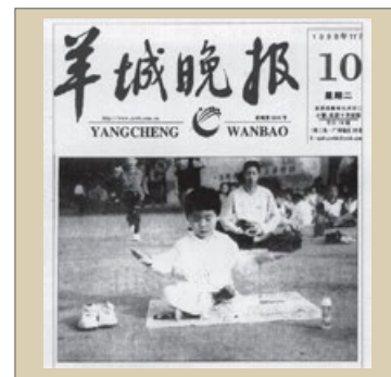
羊城晚报：老少皆练法轮功（1998年）