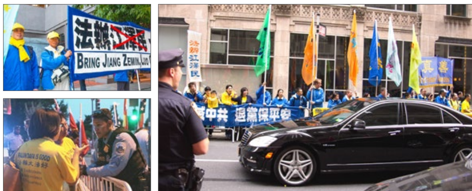
上图：西雅图维斯汀酒店外 下图：华盛顿警察听法轮功 学员讲述受迫害经历