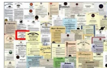
来自国际社会的褒奖（部分）