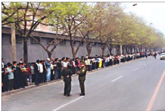
“四二五”上访现场秩序井然，法轮功学员安静平和，警察悠闲地在一旁聊天。

法轮功学员在上访中提出的三点要求是：一、释放天津被捕的法轮功学员。二、给法轮功学员一个宽松的修炼环境。三、允许出版法轮功书籍。从三点要求也可以看出，法轮功学员维护的是信仰自由和按照“真善忍”做好人的权利，与“搞政治”毫无关系。◇