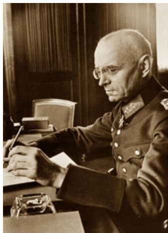
二战时的冯·法尔肯豪森

1944年6月7日，在艾海德姆镇附近的艾克兴市，地下抵抗组织杀死了3个德国盖世太保。德军开始疯狂报复，逮捕了97名青年