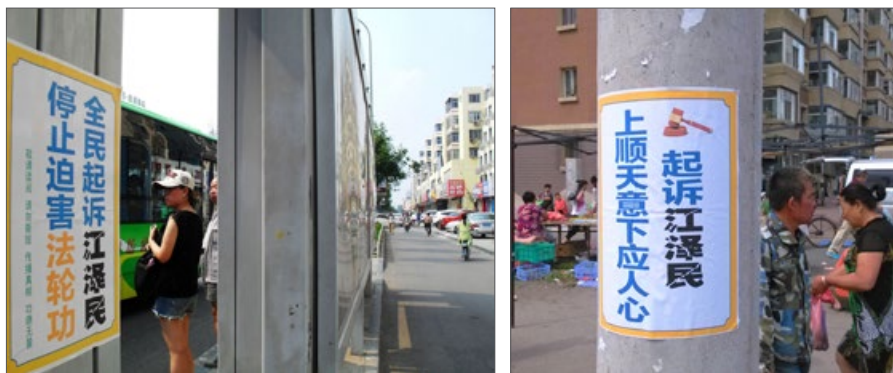
中国大陆多地可见“起诉江泽民”的标语（摄于河北廊坊、吉林长春）