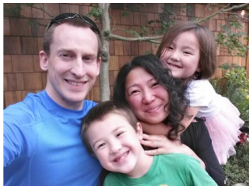
马克夫妇和一双儿女

这次经历，让马克对修炼有了更深刻的认识，对人生也有了新的理解。对于法轮大法讲的宇宙、天体、另外空间，他好像一下子