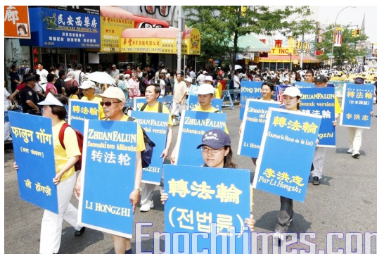
■ 现在《转法轮》一书被译成30多种语言出版发行

我去后重建规章制度，给他们讲做人的道理。我对他们说：“你们过去的事我不知道也不追究，我现在能做到的你们也必须做到，如果哪个以后违反规章制度和法律，依法按章处理。”我以诚相待，给他们讲人生哲学，讲善恶有报是天理，从心灵上改变他们。错事不讲情，小事不违规，私事关心人，困难尽力帮，在他们中