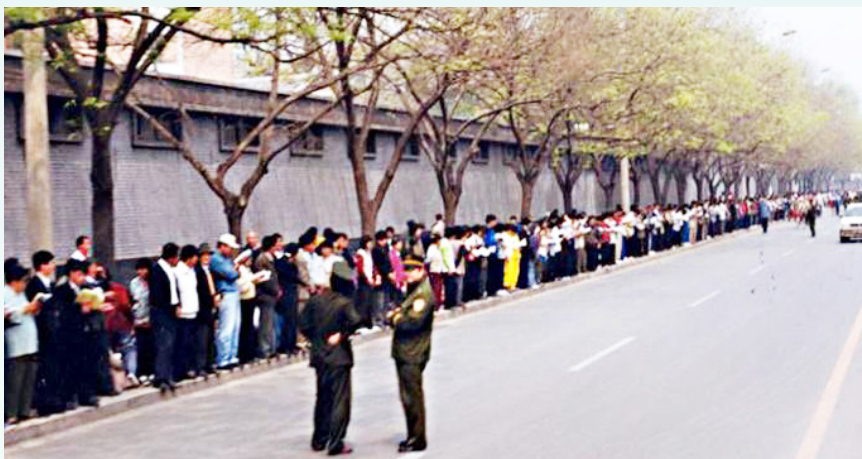
1999年4月25日和平上访，文明安静，秩序井然，警察在一旁聊天。

1999年4月，何祚庥（时任中共政法委书记罗干的连襟）在《青少年科技博览》上发表诬陷法轮功的文章。4月24日，天津法轮功学员去杂志社澄清事实却遭殴打，40多人被非法抓捕。天津公安不放人，却说：“你们去北京吧，去北京才能解决问题。”