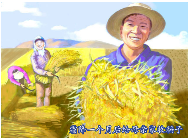
霜降一个月后给母亲家收稻子

不知不觉中到了秋收的季节。全屯的人都陆续地开始收割水稻了，只有我母亲家的稻子还又青又绿地站在田里。说也奇怪，霜降的日期都已经过了，可那段时间的天气却一直都是风和日丽，我记得父亲总是乐呵呵地念叨着，希望能晚点下霜。没几天的工夫，上下几百亩的