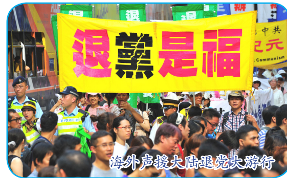
海外声援大陆退党大游行

那么天灭中共的时候，那些发过毒誓把生命献给它、为它奋斗终生的党、团、队员们，就会成为它的陪葬品。退出中共是良心与正义的选择，是在给自己选择美好的未来。“三退”不是让您去组织内退，而是您向上天表态决裂这个邪恶组织，抹掉这个邪恶誓约。“三退”也很简单，用真名、小名、化名都可以，用翻墙软件在大纪元网站退或者将“三退”声明贴到公共场所。老天看的是人心。◇