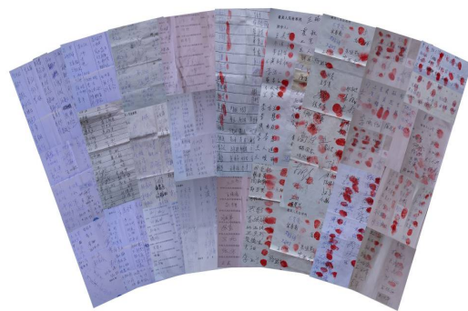
998 位善良民众签名举报江泽民

一位签名者说:江泽民太坏了,应该告他。有位农民说:江泽民把咱老百姓害苦了,早就应该告他。每个明真相签名的人都希望把江泽民早日绳之以法,早日结束这场持续十六年之久的人权灾难,还中国人民一个没有邪恶的安居乐业的生存环境。◇