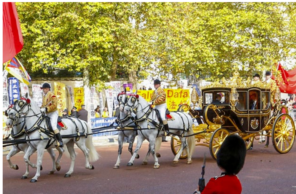
英国女王伊丽莎白二世同习近平乘坐的马车路过法轮功真相横幅