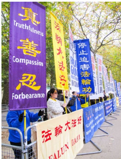
法轮功学员展示真相