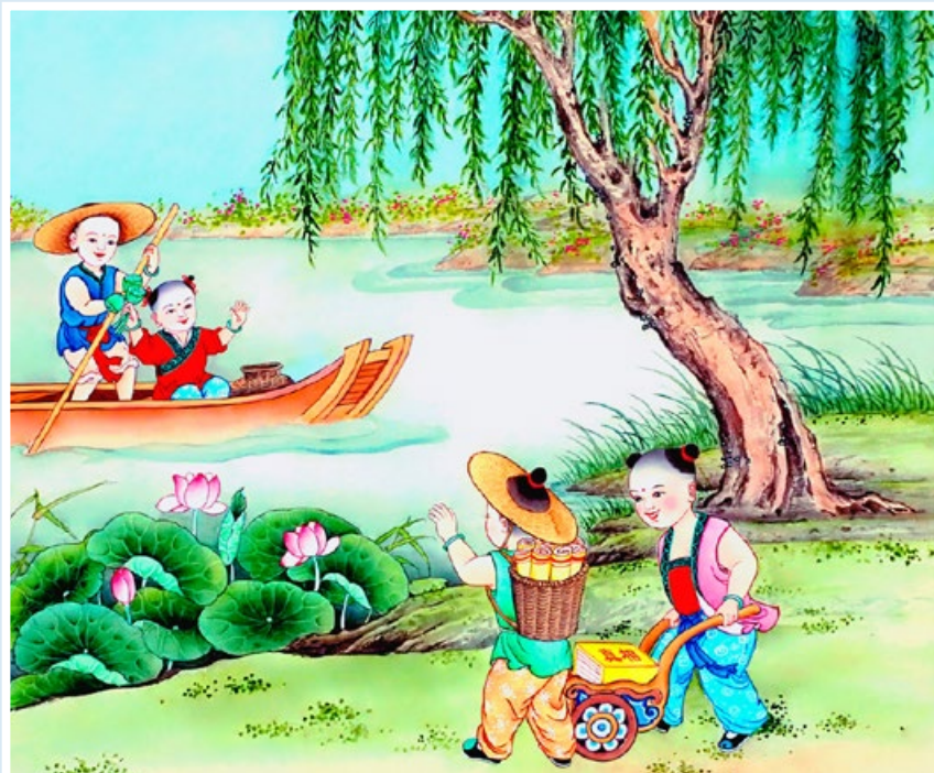
绘画《真相送福》 作者：中国大陆法轮功学员