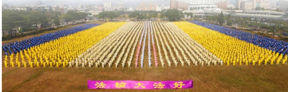
■ 2013年台湾逾六千法轮功学员于台南市府前集体炼功

法轮大法是性命双修的功法。强调以修心性为本，动作是修炼圆满的辅助手段。所以最主要是学习法轮功著作，提高道德，辅之以炼功，这样，才能达到祛病健身的效果，也才能达到修炼圆满的目的。此法圆容明慧，动作简练，“大道至简至易”。法轮大法一切活动都是公开的、自愿的、免费的，男女老少皆可修炼。