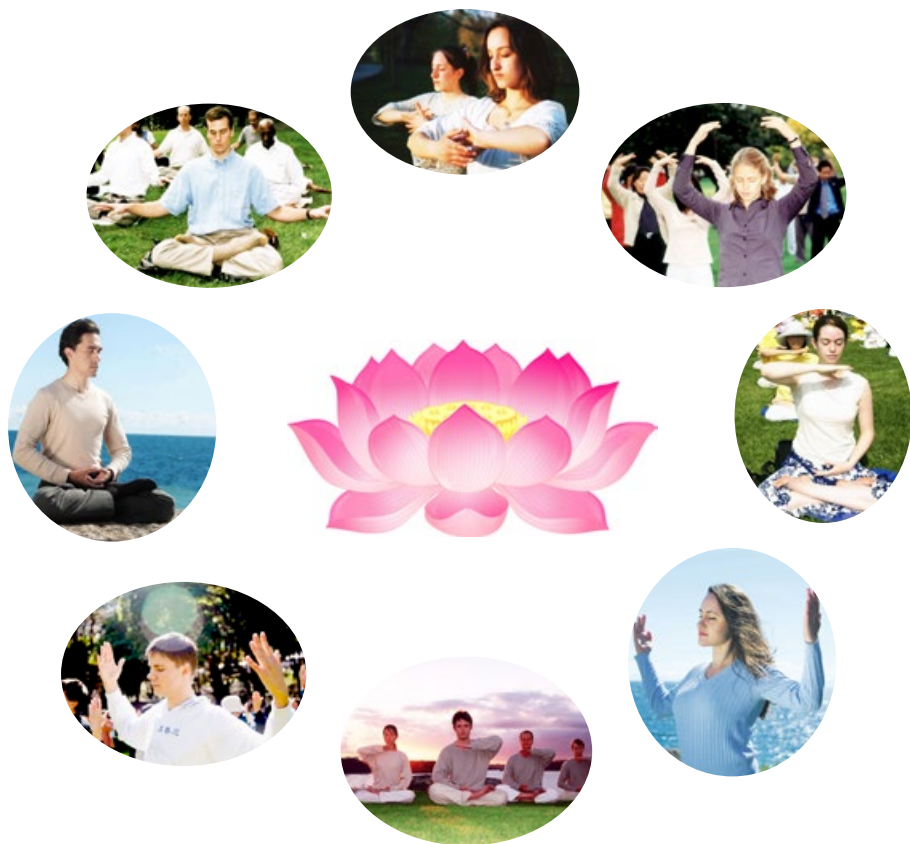
■ 法轮大法弘传世界百余国

北宋著名预言《梅花诗》，在结尾处描述了人类历史大戏的最后一幕，就是法轮大法传遍世界，诗中写到“数点梅花天地春”，经过严冬考验的法轮功弟子遍及世界，如傲霜雪的朵朵梅花迎接春天的到来，法轮大法的福音传遍人间。今天，在我的身边已经能看到这一幕的缩影。（文 / 丽真）