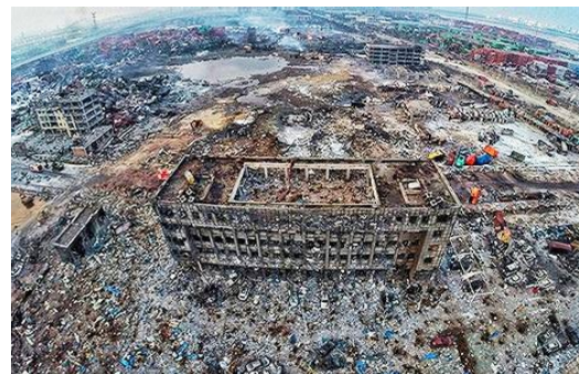
■ 天津滨海新区大爆炸