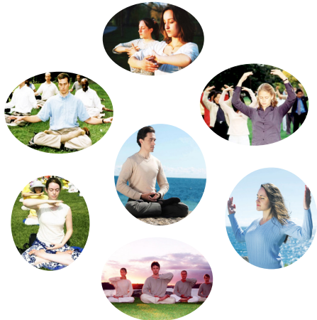
■ 法轮大法弘传世界百余国

有一天分厂同事到我们总厂开会，会议结束后，四个男同事来找我，问：“有没有法轮功真相光盘？给一张。”我拿出四张，其中一人说：“一人一张啊，太好了！太好了！” 还有一天，保卫处的负责人到我办公室，他说：“法轮功好，谁要是来抓你们这样的好人，我们可不让！”我真为这些同事高兴。 北宋著名预言《梅花诗》，在结尾处描述了人类历史大戏的最后一幕，就是法轮大法传遍世界，诗中写到“数点梅花天地春”，经过严冬考验的法轮功弟子遍及世界，如傲霜雪的朵朵梅花迎接春天的到来，法轮大法的福音传遍人间。今天，在我的身边已经能看到这一幕的缩影。(文/丽真)