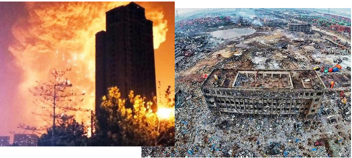
天津滨海新区大爆炸

第二天才知道，我们才离开宾馆一个多小时，附近的天津市瑞海物流公司的化学品仓库就发生了大爆炸。我们住宿的旅店是重灾区，因此我们凡人