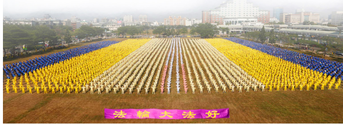
■ 2013年台湾逾六千法轮功学员于台南市府前集体炼功

法轮大法是性命双修的功法。强调以修心性为本，动作是修炼圆满的辅助手段。所以最主要是学习法轮功著作，提高道德，辅之以炼功，这样，才能达到祛病健身的效果，也才能达到修炼圆满的目的。此法圆容明慧，动作简练，“大道至简至易”。法轮大法一切活动都是公开的、自愿的、免费的，男女老少皆可修炼。