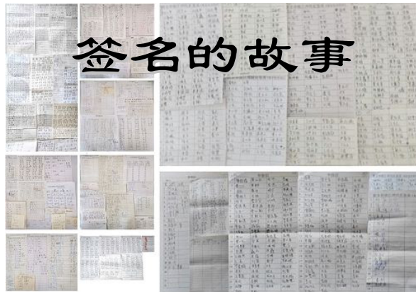
■长沙民众签名举报江泽民人数增至 2938 人

过后她并没把这事放在心上。有一天，她突然接到了以前应聘过的一家大公司的面试通知。面试的有三十人，媛媛没抱什么希望。没想到两天后公司通知她复试。十二人中录取一人，竞争还是相当激烈，相比之下媛媛也不是最优秀，最后她却幸运地被选中了。这份工作相对来说不繁重，工资和福利待遇都好。这真是出乎她的意料，以前她连想都未想过的。◇