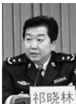
原广州市公安局副局长 祁晓林 自缢身亡