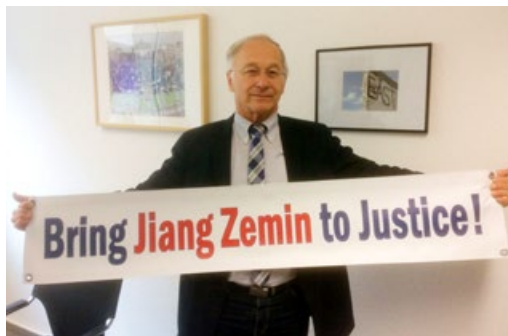
德国联邦议会议员马丁·帕策尔特手举“法办江泽民”的横幅