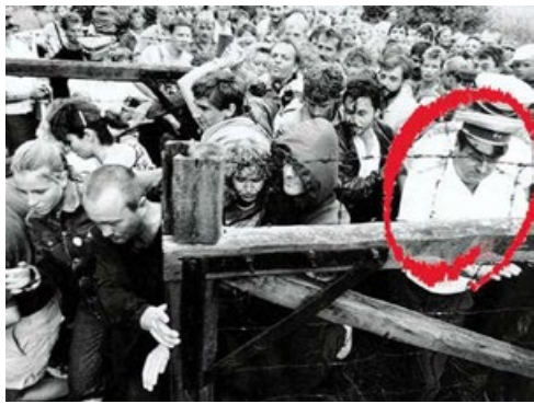
1989年8月19日匈牙利边境一幕

1989年8月19日，匈牙利开放了通往奥地利的边境，首次让民众到奥地利参加泛欧野餐。当天下午，边境上就挤满了人，但大部分是在匈牙利度假的东德人。他们的目的很明确：进入奥地利，然后到西德，再也不回共产党统治的东德了。