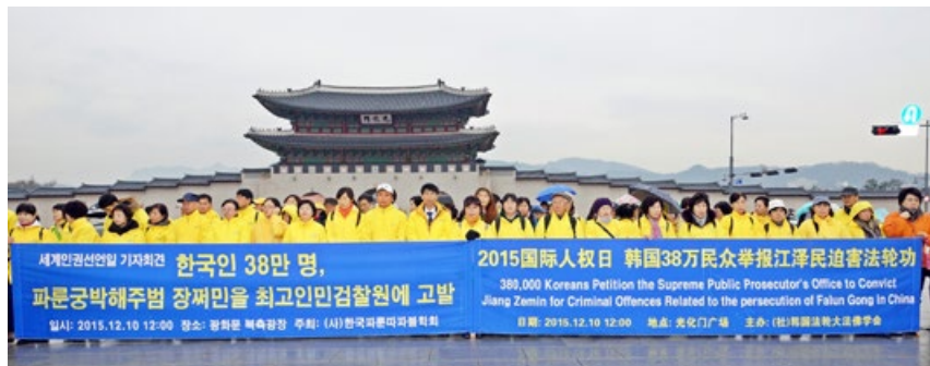
韩国 38 万人举报江泽民，亚洲逾 100 万人签名举报江泽民。图为韩国法轮功学员举办“百万签名举报迫害元凶江泽民”记者会。