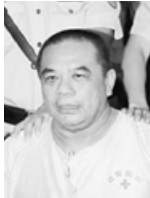
原广州市公安局副局长 何靖 被判无期

这些警官曾因掌握大量维稳资金而耀武扬威，现在都遭到报应。他们的上司、原广州市委书记万庆良也被移送司法。