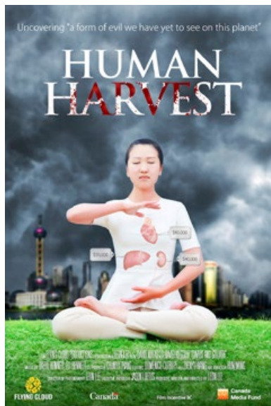
获奖纪录片《活摘》海报

《活摘》纪录片已经在二十多个国家的电视台播映, 民众被片中的真相震撼, 反响强烈。◇