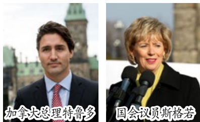
加拿大总理特鲁多 国会议员斯格若 加拿大新总理向中国领导人提出法轮功受迫害问题

◆ 2015 年 12 月 9 日，台湾高雄市议会全体议员通过提案，声援中国大陆民众控告江泽民，呼吁停止迫害法轮功。该提案