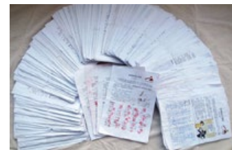
河北唐山 27461 位市民签名支持对江泽民的控告

◆ 目前，签名向中国最高检察院刑事举报江泽民的大陆居民日增，其中河北保定地区 2000 多人，黑龙江建三江 1350 人，湖南长沙市 1577 人，河北张家口市 200 多人，贵州遵义市近 200 人，黑龙江密山市 998 人，辽宁锦州市 1162 人，河北唐山市 27461 人。◇