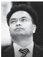
原广州市委书记万庆良 被控受贿一亿余元受审

这些警官曾因掌握大量维稳资金而耀武扬威，现在都遭到报应。他们的上司、原广州市委书记万庆良也被移送司法。