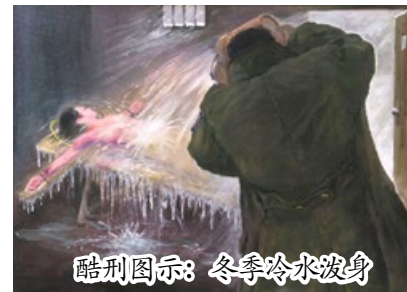
酷刑图示：冬季冷水泼身

沈阳监狱城内的沈阳市第一监狱（关押男性），专设“高戒备监区”对法轮功学员酷刑洗脑，手段包括：往眼睛里喷辣椒水、用冰块冰冻睾丸、坐老虎凳、多根高压电棍电击全身等。