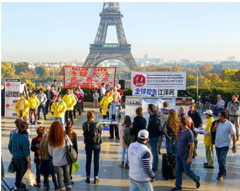
艾菲尔铁塔下的法轮功真相点