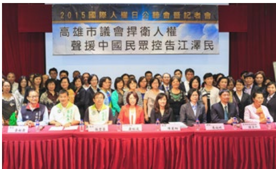
台湾高雄市议会全体议员通过提案，声援中国民众控告江泽民。