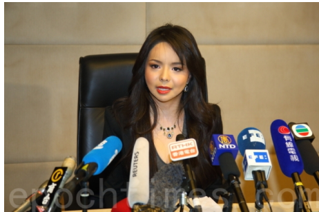
图：林耶凡召开新闻发布会

瑞士《时代报》(Le Temps)报道，当选“加拿大小姐”的林耶凡被中共拒绝访问她的故国。自 1951 年以来每年举办“世界小姐”大赛，“使命之美”是“世界小姐”大赛的口号，2015 年 12 月 19 日“世界小姐”大赛将在中国海南三亚举行。加拿大小姐却不能出席，缺席的原因恰恰因为她坚持了“使命之美”的原则。这位年轻的女子是个大学毕业生、钢琴家、女演员、法轮功支持者以及人权活动家。她从事的活动，使其成为一个中共“不欢迎的人”。林耶凡夺得“加拿大小姐”冠军之后，起初在中国受到热烈欢迎，但随后国安骚扰了她在大陆的父亲。父亲试图说服她不要再出声，否则他不能再和她联系。就像对待体育运动员、音乐家一样，中共对“选美皇后”也要过滤。