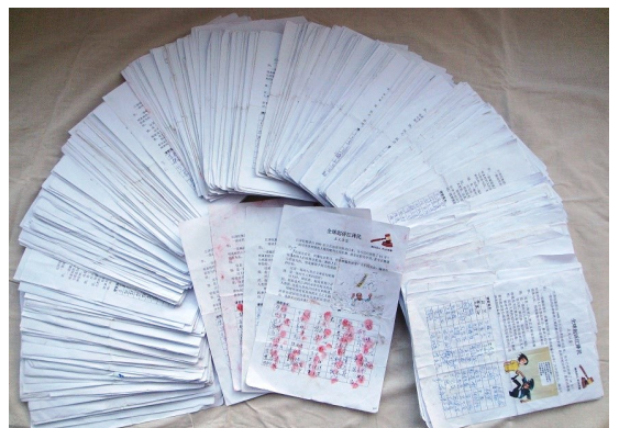
河北省唐山市民众已有二万七千四百六十一人签名支持对江泽民的控告。

◎二零一五年十一月二十九日，全球影视之都美国好莱坞迎来第八十四届圣诞大游行，为圣诞节拉开序幕。法轮功学员应邀参加，包括天国乐团、法轮大法旗队、舞蹈队、花车、腰鼓队等，引人注目。