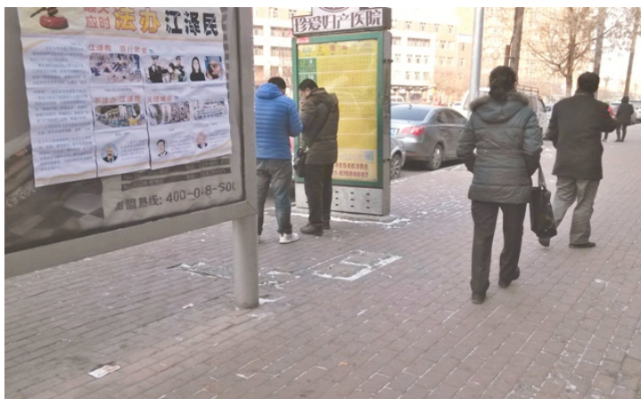
长春街头、伊通河畔出现呼吁法办江泽民的展板

那年正好湖南资江发生特大洪水灾害，大约是 7 月 23 日，益阳民主垸（沙头路段）发生特大管涌溃堤。大堤垮了，灾区数十万老百姓正遭受洪水肆虐，湖南的电视台觉得污蔑法轮功的机会来了，想出了一个诬陷法轮功的假新闻。