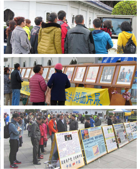
台北法轮功学员炼功 右上图：大陆游客看中共导演的“天安门自焚”假案视频。右中、下图：大陆游客看图片展和真相展板。