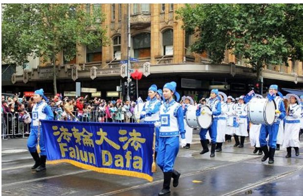
墨尔本法轮大法协会再次受邀参加一年一度的澳大利亚国庆日盛装大游行

©2015 年 1 月 26 日, 墨尔本举行了一年一度的澳大利亚国庆日盛装大游行, 墨尔本法轮大法协会再次受邀参加。主持人在介绍法轮功队伍时, 说道: “欢迎法轮大法的队伍经过市议会大楼。法轮大法是一种古老的修炼打坐功法, 她基于普世原则——真善忍, 修炼者遍及澳大利亚和全世界 100 多个国家。法轮大法免费教功, 欢迎所有人来尝试这一安静祥和的功法。”