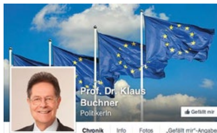
欧议会人权委员会议员布赫讷的脸书截图

2015 年 2 月 5 日，欧洲议会人权委员会议员克劳斯·布赫讷（Klaus Buchner）先生再次透过脸书公开谴责中共当局迫害“黑龙江建三江事件”中的法轮功学员。20 多位欧洲议员联署声援法轮功学员和正义律师，要求立即释放法轮功学员石孟文、王燕欣、李桂芳与孟繁荔，保障律师的人身安全。