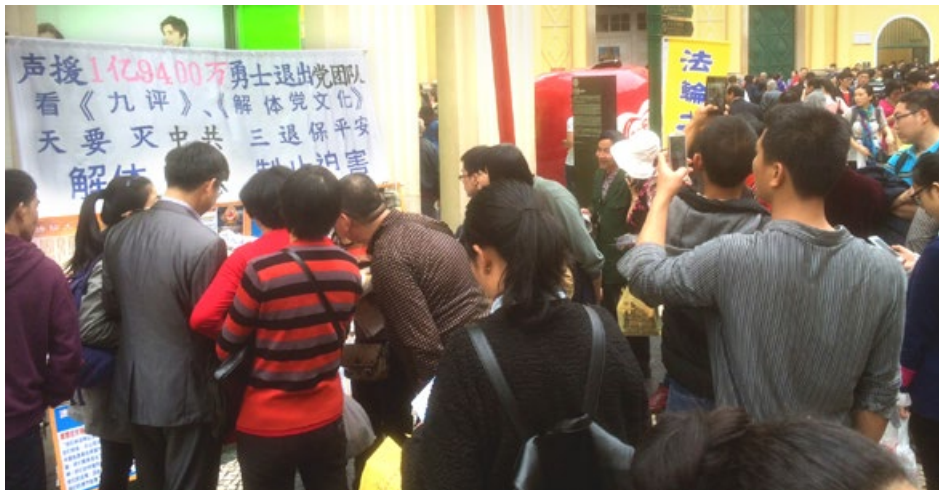
来澳门旅游的大陆游客渴望了解真相