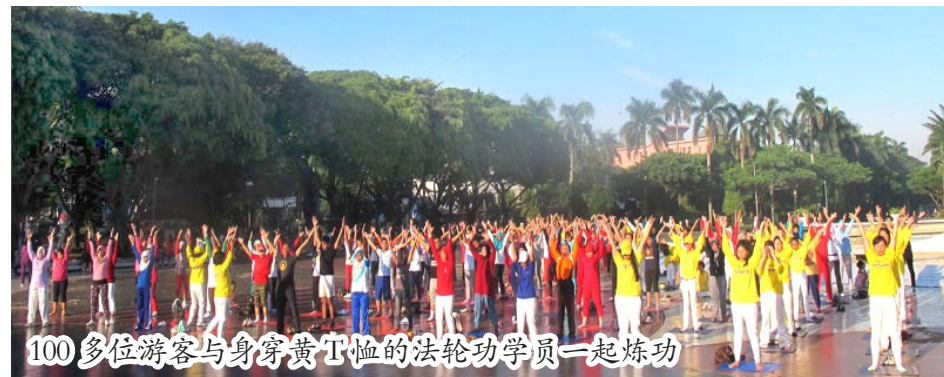
100多位游客与身穿黄T恤的法轮功学员一起炼功

印尼微缩公园是著名旅游区，为了庆祝中国新年，这里在羊年的正月初一至初四举办了“中国－印尼文化周”活动，当地法轮功学员受邀参加，舒缓美妙的法轮功五套功法吸引了100多位游客学炼。◇