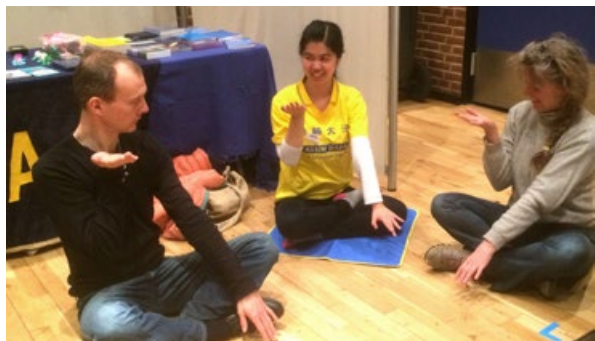
上图：健康博览会上，法轮功学员与不同族裔的观众用汉语、丹麦语、英语和德语交谈。