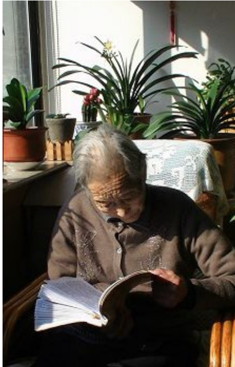
图: 九旬母亲读法轮大法书籍。

好, 真善忍好, 请师尊保佑, 得到慈悲师尊的护佑。是师尊给我母亲又延续了生命。感恩师尊的泪水瞬间夺眶而出。叩谢师尊!