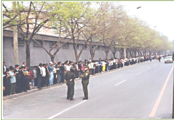
秩序井然, 祥和宁静的四·二五上访现场

现代社会无论购房、贷款, 都需要信用记录。法轮功修炼者在过去十六年里, 建立了完美的信用记录。在法轮功学员遭到中共凶残迫害的十六年里, 从来没有发生一起法轮功学员以暴易暴的报复事件。除了中共导演炮制的“天安门自焚栽赃案”, 在大陆和海外从未发生任何类似过激事件。贪污腐败等在中共司空见惯的事情更是和法轮功学员不沾边。法轮功学员都有正常的工作和家庭, 重德修心,