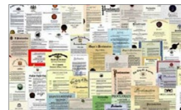
来自国际社会的褒奖（部分）