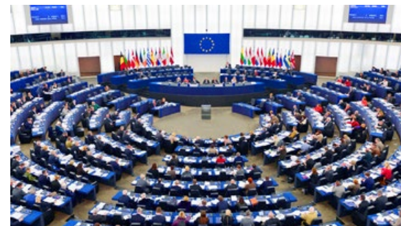
欧洲议会通过决议案，要求中共立即停止活摘器官、释法轮功学员。（2013年12月12日）

这场由中共前党魁江泽民下令进行的，由中共政府、军队统一管理，从监狱、法院、医院形成一条龙的秘密大屠杀，是对全人类的犯罪，是人类前所未有的罪恶。它冲击着每一个人的良知，挑战着人们的道德底线。在这大善大恶面前，每个人都应该站起来维护人类的尊严，谴责中共对人类犯下的滔天罪恶。◇