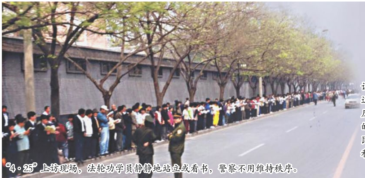
“4·25”上访现场，法轮功学员静静地站立或看书，警察不用维持秩序。