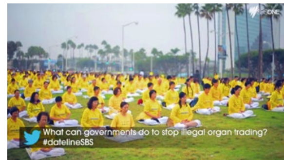
2015年4月7日，澳洲政府拥有的主流电视频道SBS在Dateline专题节目中播放了多次获大奖的加拿大纪录片《活摘》的部分内容，该片揭露了中共活摘法轮功学员器官牟利的惊天黑幕。澳洲各界民众震惊，纷纷谴责中共暴行。图为纪录片《活摘》播出的网络截图。