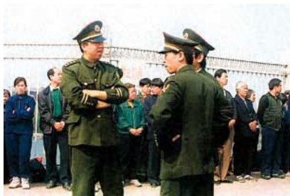
法轮功学员安静有序，警察不用维持秩序，在一旁聊天。

◆ 修炼的人在哪里都要做一个好人，在对与错、是与非面前的苟且也许能换得暂时的安宁，但那是懦弱，绝不是忍。一个社会道德崩溃的开始，正是从社会的每个成员放弃善恶的原则开始。如果人人都认同强权就是真理，或者把现实利益当作行为准则，那这个社会就失