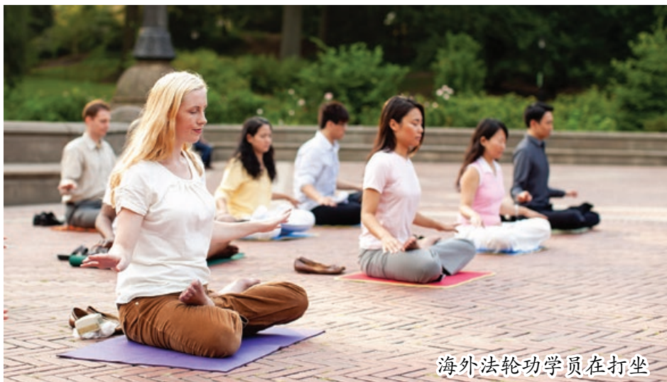
海外法轮功学员在打坐