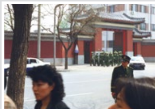
与上访者隔街相望的是中南海西门