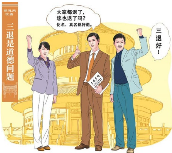
明慧征图：“您也退了吗？”