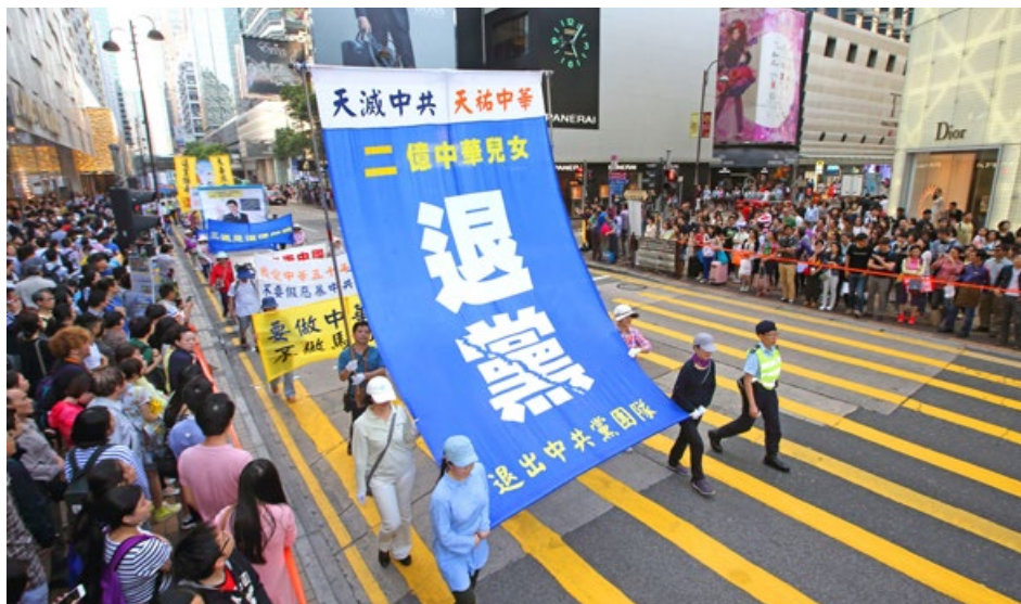
香港大游行声援2亿中国人退出中共 (2015年4月25日)