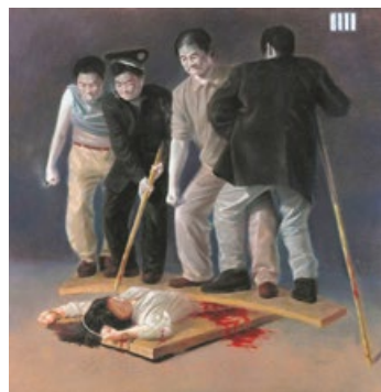
中共酷刑图示（油画）

“而那些参与迫害的人是最可悲的。我认识一位北京法轮功学员，她已怀有7个月的身孕，却被4个警察用门板压在身上踩踏、逼迫她‘转化’！那些警察也是母亲所生养的啊，竟败坏到如此天良丧尽的地步。不难想象，当‘真善忍’被从人们心中抹去，这个世界将走向何处？等待人的将是什么？”