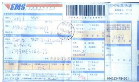
图：孙平华给最高人民检察院、最高人民法院的二封 EMS 回执的照片。

元凶江泽民犯有灭绝种族罪、酷刑罪、危害人类罪、剥夺公民人身自由罪、剥夺公民财产罪、故意伤害罪、刑讯逼供罪等。