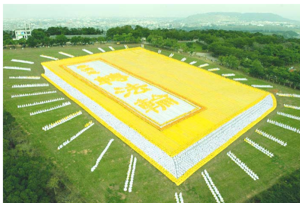
是数千名法轮功学员台湾集体炼功，排组《转法轮》书籍模型。（2009 年）

我激动地大喊：“法轮功是神功！法轮大法果然好！”老伴看到我高兴的样子，也眼红地说：“我有好多老病，我也要修炼！”