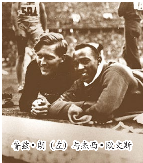
鲁兹·朗（左）与杰西·欧文斯