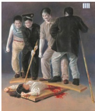
中共酷刑图示（油画）

“令人痛心的是，中共迫害法轮功不知毁掉了多少人！而那些参与迫害的人是最可悲的。我认识一位北京法轮功学员，她怀有7个月的身孕，却被4个警察用门板压在身上踩踏、逼迫她‘转化’！那些警察也是母亲所生养的啊，竟败坏到如此天良丧尽的地步。不难想象，当‘真善忍’被从人们心中抹去，这个世界将走向何处，等待人的将是什么。”