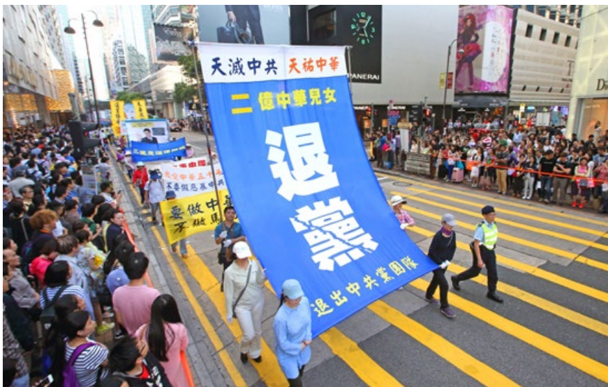
香港大游行声援2亿中国人退出中共（2015年4月25日）