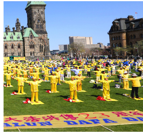
加拿大国会山前集体炼功