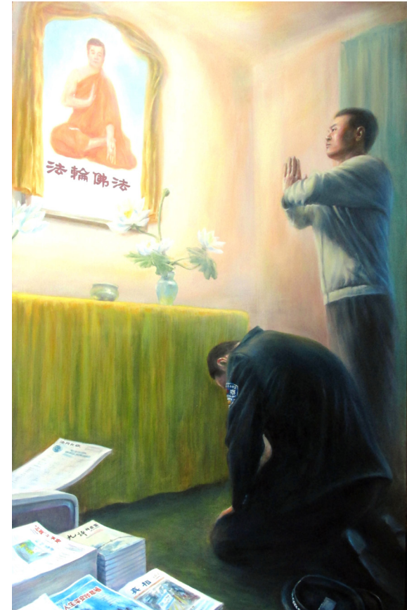
作者：中国西北地区法轮功学员 归真