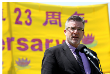
国会议员克莱格·斯哥特