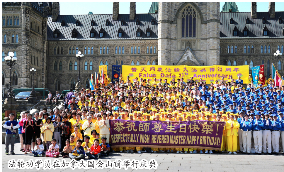
法轮功学员在加拿大国会山前举行庆典