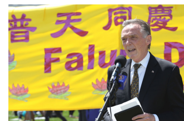
国会议员彼得·肯特