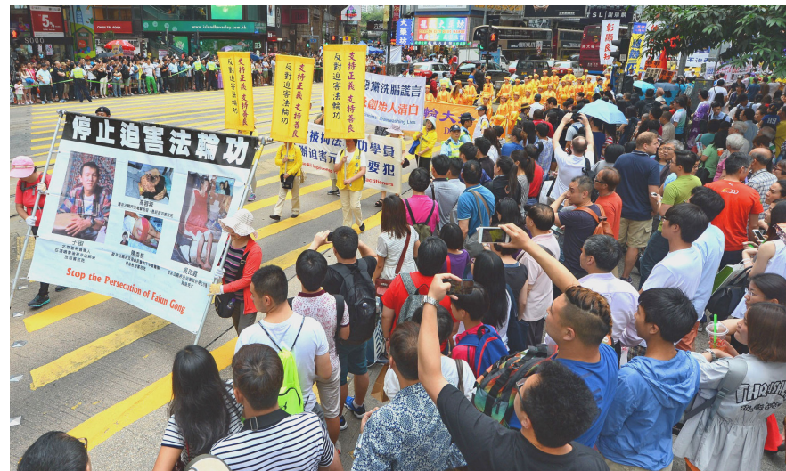
2015 年 5 月 10 日香港法轮功学员大游行，大陆游客争相拍摄中共江泽民集团酷刑迫害法轮功学员致毁容、致死的真相。

自从建立了“处理法轮功问题领导小组”和“610 办公室”以后，对法轮功的迫害就由各级“处理法轮功问题领导小组”和“610 办公室”监督和实施。尤为恶劣的是，各级“610 办公室”接受其上一级“610 办公室”的指令，要求其工作人员对法轮功信仰者强行“转化”（逼迫放弃信仰），手段包括洗脑、虐待和酷刑折磨。（选摘自《被告江泽民在迫害法轮功中的作用和角色》）◇