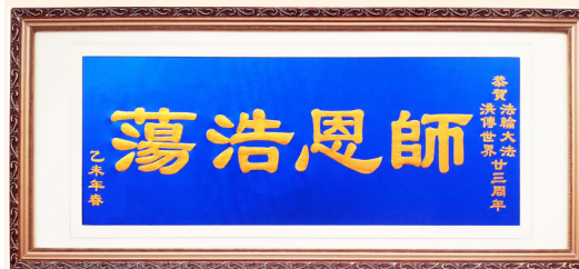
布贴画：师恩浩荡（大陆法轮功学员恭贺法轮大法弘传世界 23 周年）

此外，查看作为中共喉舌的数据库 People.com.cn，在中共中央之下，并没有关于“处理法轮功问题领导小组”或“防范和处理 × 教问题小组”的正式名称。因此，它是一个秘密组织，