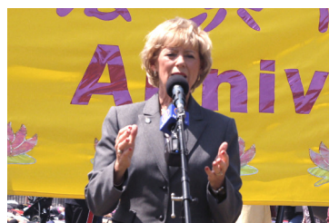
国会议员朱迪·斯格若