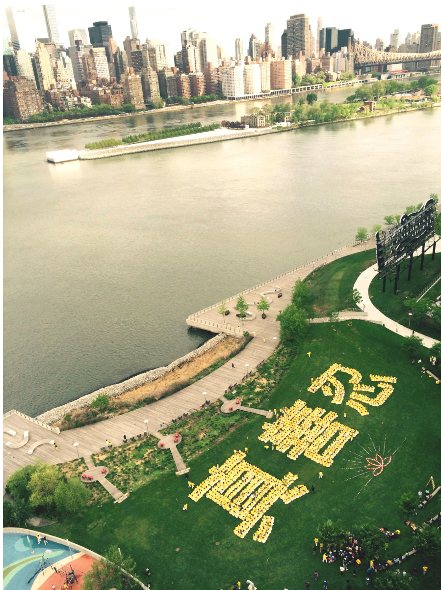
摄影：千名法轮功学员排字 “真善忍” 首现纽约联合国 (2015 年 5 月 13 日摄于美国纽约联合国总部大楼对岸的甘纯公园)