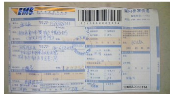
向两高邮寄控告书的收据