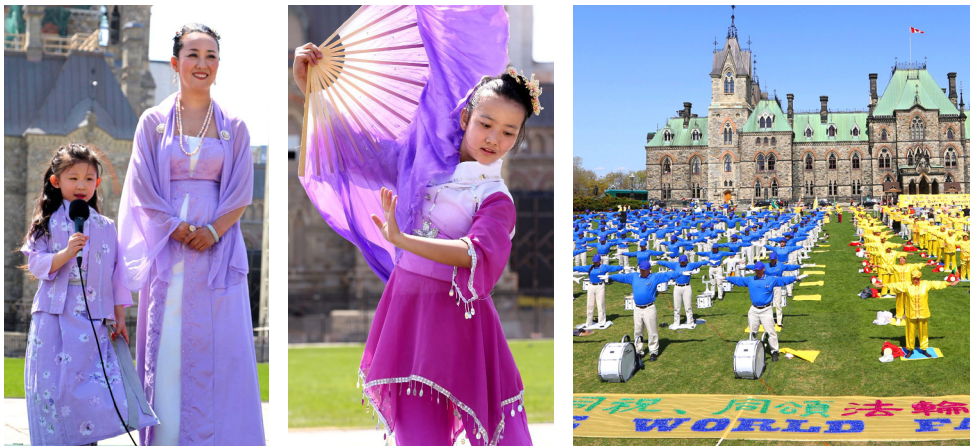
法轮功学员在庆典上表演歌舞

曾是国际人权律师的克莱格·斯哥特议员表示很清楚法轮功学员在中国经历的艰苦抗争。他说：“我要赞扬你们对信仰的坚定。你们的努力使人们认清了发生在中国的自1999年以来的这场迫害真相。”“感谢你们的努力和你们的坚持。”