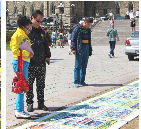
民众阅读法轮功真相

内的情况我非常清楚，因为我的邻居都在炼，他们都是非常善良和诚实的人，现在中国善良的人就存在于这群人中了，我非常敬佩他们。在国内，他们受监控；在海外，他们是如此自由和受欢迎。”他表示要在现场学炼法轮功。