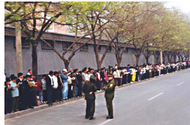
“4·25”上访现场安静，警察不用维持秩序，在一旁聊天。国际社会称此次上访为“中国上访史上最理性、平和的上访”。

从上述“三点要求”也可以看出，法轮功学员只想拥有一个自由修炼的环境和做好人的权利，不牵扯任何政治问题。“搞政治”之说只不过是中共整人的“大帽子”。◇