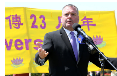
国会议员布莱德·巴特