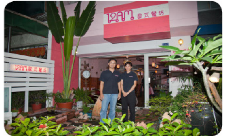
뒤통수치기와 쟈자메이 부부

8년전, 한 우연한 기회에 그들 부부 두 사람은 파룬따파를 수련하기 시작했다. 이로부터 과거 화목하지 않던 이 가정에 복이 내려 두 사람은 마치 탈태환골한 듯이 청신하고 상서롭게 변했다. 쌍방의 부모들도 얼굴에 웃음꽃이 피어나 자식들이 효도하는 즐거움을 마음껏 누리게 되었다!