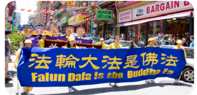
해외 파룬궁 수련생 반 박해 시위 행진

나는 진심으로 리대사님께 감사드립니다! 파룬궁 수련생에게 감사드립니다! 당신들 하루 빨리 자유를 얻기 바랍니다! 나는 이미 《전법륜(转法轮)》을 보고 있으며 당신들이 자유로울 때 나도 당신들 따라 함께 련공하겠습니다. ◇