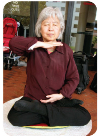
류징항녀사 파룬궁을 련마하고 있다.

파룬궁 수련생이 천진시 정부에 가서 사람을 내 놓으라고 요구했더니 : 공안부에서 이 사건에 개입하였기에 당신들은 북경에 가야만 문제를 해결할 수 있다고 알려주었다.