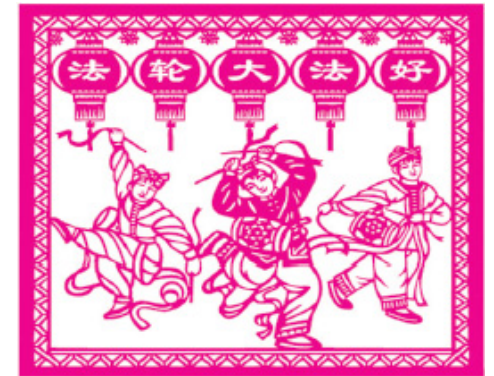
파룬궁 수련생 종이 공예 작품.

나는 목기 공장에서 직장인들과의 만나는 나날을 매우 소중히 여기었다. 공장의 년로한 사람, 젊은 사람들은 나를 만나면 모두 매우 친절했고 매번 판공실에 결혼 사탕, 대추 같은 것들이 있으면 처녀들은 모두 밥 짓는 이 아주머니에게 남겨 두었다. 전후근의 대부분 직장인들은 모두 내가 말한 파룬궁 진상을 들었고 그들은 모두 나 이 대법제자를 믿었다. 명백히 알고 난 후 매우 많은 사람들은 모두 “3퇴” (탈당, 단, 대) 하고 자신을 위해 아름다운 미래를 선택했다.◇