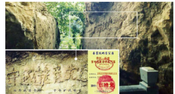
2002년, 귀주 평당현 장포항에 놀랍게도 지금부터 2.7억 년 되는 거석이 나타났으며 위에는 큰 글이 나타났다 : 중국공산당 망 (왼쪽 아래 켄 그림은 풍경구 문표이다)

그렇다면 하늘이 중공을 멸할 때 그런 독 맹세를 한 사람은 생명을 그것에게 바치고 그것을 위해 종신 분투하겠다고 한 당, 단, 대원들은 바로 그것의 순장품이 된다. 이것은 바로 한 사람이 간암에 걸려 죽는 것처럼 비