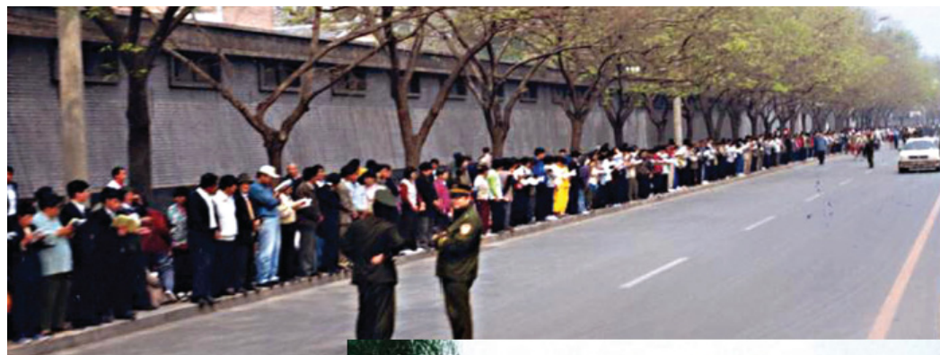
■ 1999 년의 4월 25일, 파룬궁 수련생 평화상방이다. 떠난 후 땅 바닥에는 종이 조각 하나 없이 경찰이 던진 담배 궤초리마저 그들이 주었다. 한 경찰은 감개하며 말했다: “보세요, 이것이 바로 덕입니다!”

대략 아침 8시경에 계엄이 시작되었고 부유거리에는 많은 경찰차가 서 있고 한줄로 밀집히 있는 무장경찰과 파룬궁 수련생은 서로 마주 보고 있었다. 경찰의 장애물 제거 차량도 오가고 있었고 그리고 촬영기를 든 사람이 자동차위에서 오가며 록상하였는데 그 누구도 루락될 수 없었고 누구나 이것은 일이 끝난 후에 기회를 노려 보복하려는 것을 똑똑히 알고 있었다. 길에는