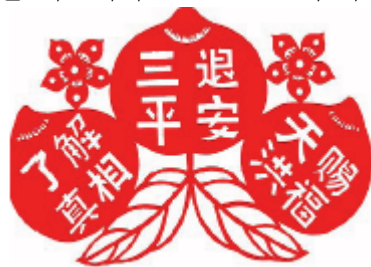
파룬궁 수련생 종이 공예 작품.

이것이 바로 파룬궁 수련생이 차사고에 대한 태도이다. 그들은 본래 차사고의 피해자이지만 그들은 도리어 운전기사를 생각하였다. 무엇때문에 중공이 수단을 가리지 않고 파룬궁을 날조하고 먹칠하지만 파룬궁에 대한 중국민중들의 태도는 갈수록 좋아지고 있는가? 그들이 차 사고를 처리하는 방식에서 사람들은 혹시 그 답안을 얻을 수 있을 것이다.◇