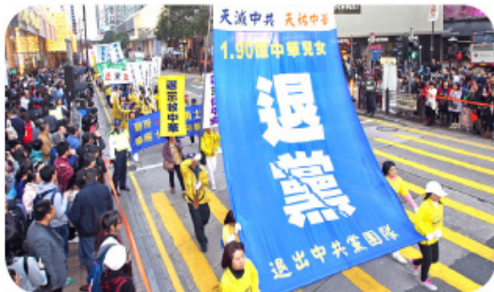
해외 파룬궁 수련생 반박해 대 시위행진

곰곰히 생각하면 수시로 중공을 위해 일체를 희생할 준비를 하겠다는 맹세는 얼마나 악독한 맹세인가! 당연히 대다수 사람은 진정으로 그것을 위해 “일체를 희생” 하려 하지 않